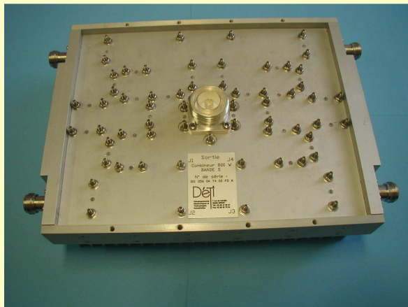
REF : 001356 0A